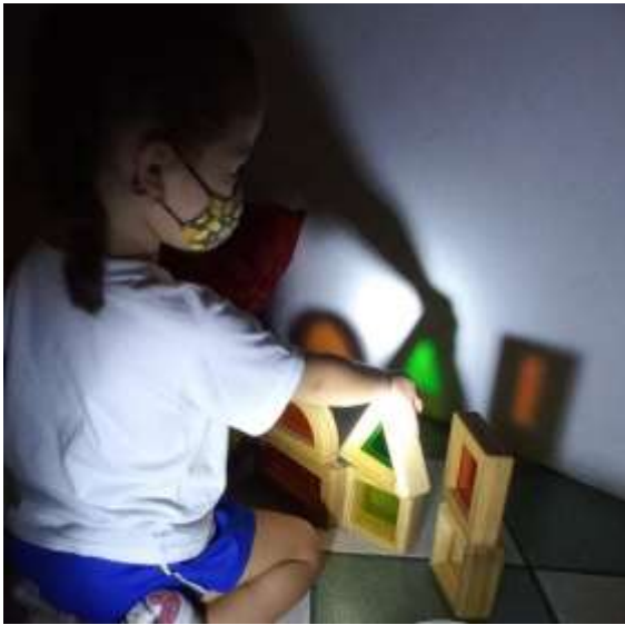
“Tô montando meu prédio!” M.T