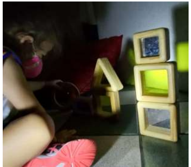
“Vou fazer minha casa.” J.S

Cada criança escolheu o bloco com a cor que mais chamaram sua atenção, logo empilharam um em cima do outro formando uma casa, alinharam um ao lado do outro formando a parede da casa.